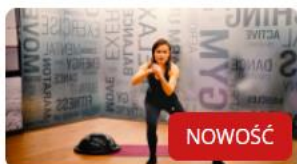
POWRÓT NA STOK