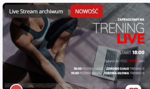
TRENING LIVE 13.12