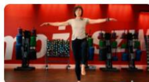
ANTYSTRES - HARMONIA