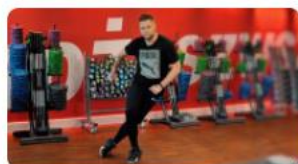
ANTYSTRES - ENERGIA